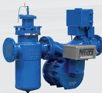
Groupes de comptage horizontal ZCE5-H