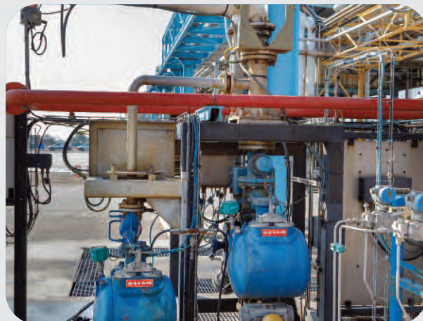
Groupe de mélange ZCE25

Le calculateur Equalis peut gérer un mélange aval avec deux compteurs implantés sur les composants du mélange ou un mélange amont avec un compteur sur un composant du mélange et le second compteur sur le produit mélangé. Dans les deux cas le calculateur assure la régulation du débit d'un composé amont par une vanne incrémentale garantissant un taux de mélange parfaitement maîtrisé. La fonction « Clean Arm », évitant toute contamination entre 2 livraisons successives, est également gérée par le calculateur.