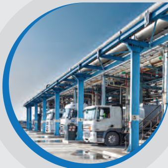
Postes de chargement camions