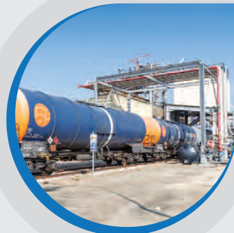
Postes de chargement wagons