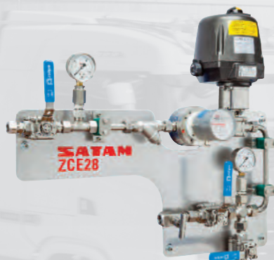
Module d'injection ZCE28 avec comptage certifié MID