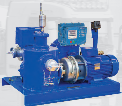
Groupe de réception avec pompe ZCE21

Ce groupe de réception, équipé d'une pompe centrifuge, permet d'assurer une vidange du camion-citerne vers les stockages aériens ou enterrés. Son séparateur de gaz intégré assure un comptage fiable dans toutes les phases du déchargement.