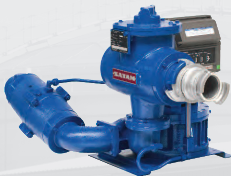
Groupe de réception gravitaire ZCE11-80

Cet ensemble de mesurage est destiné à une utilisation en vidange gravitaire de la citerne vers une cuve de stockage enterrée. Il est équipé d'un dispositif automatique d'élimination du gaz couplé à une vanne d'autorisation qui permet un démarrage et un arrêt du comptage flexible vide et donc garantit un comptage de l'intégralité du produit transféré. La version avec indicateur mécanique peut présenter, si nécessaire, un fonctionnement totalement autonome.