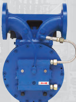
Injecteur d'additif XAD41 à commande mécanique