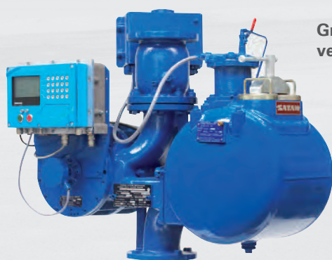
Groupes de comptage vertical ZCE5-V