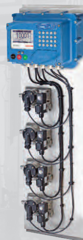
Modules d'injection gérés par le calculateur